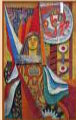
Мозаика на здании государственной Музеи на улице Дзержинского