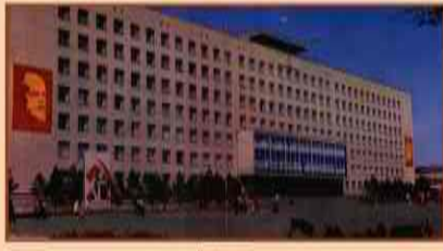
Вид на город Октябрь 1993