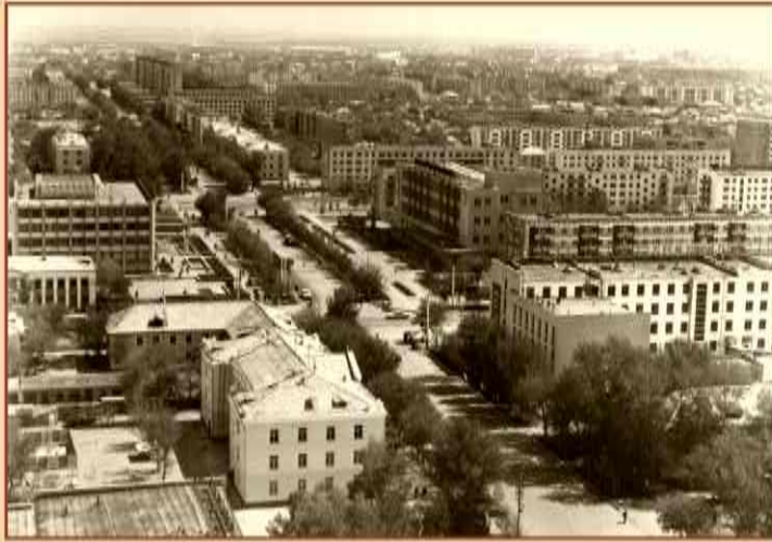
Вид на город - Июнь 1987 Вид на город - Июнь 1987