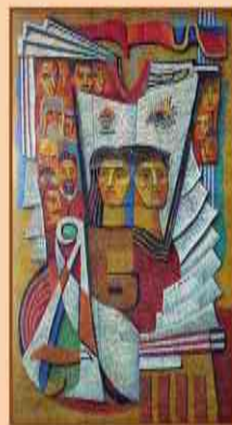
Мозаика на здании государственной Музеи на улице Дзержинского