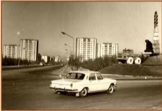
Вид на город - июль 1988 Вид на город - июль 1988